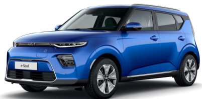
Modrá Neptune (B3A)