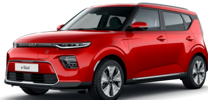
Červená Inferno (AJR)