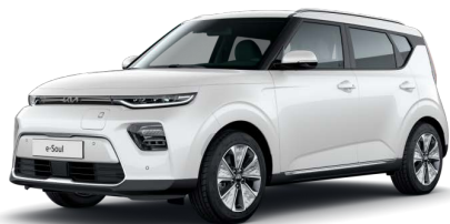
Perleťová Bílá Snow (SWP)