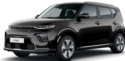
Černá Cherry (9H)