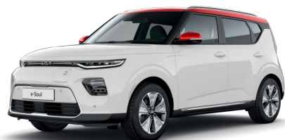
Bílá Clear + Červená Inferno (střecha) (AH1)