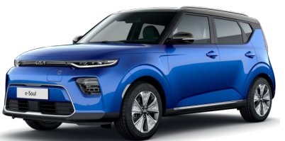
Modrá Neptune + Černá Cherry (střecha) (SE2)