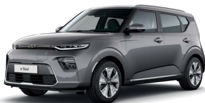
Šedá Gravity (KDG)