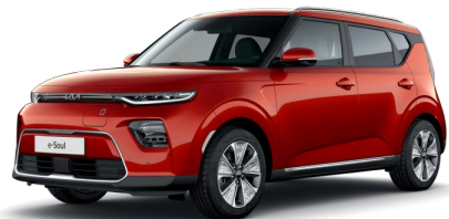
Oranžová Mars (M3R)